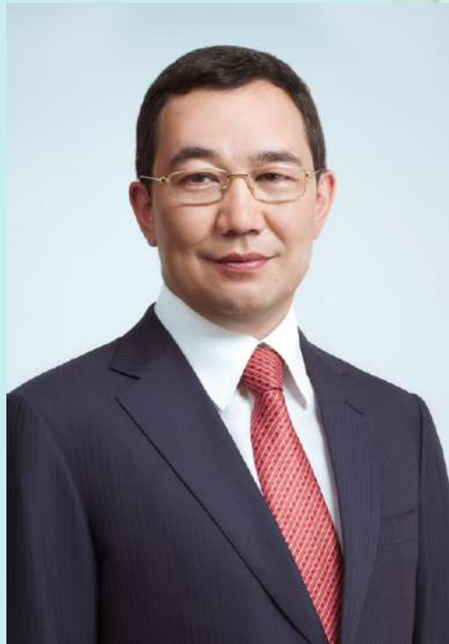
Николаев Айсен Сергеевич Глава Республики Саха (Якутия)

Непереходящей ценностью человечества всегда было и останется знание, образование. Сегодня мы подводим итоги конкурса претендентов на именную стипендию Первого Президента Республики Саха (Якутия) Михаила Ефимовича Николаева «Знанием победишь».