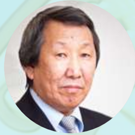
Васильев Василий Иванович

председатель, министр культуры и духовного развития Республики Саха (Якутия), к.п.н