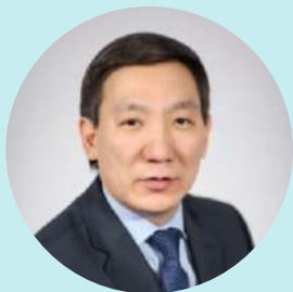
Ноев Афанасий Иванович

председатель, министр культуры и духовного развития Республики Саха (Якутия), к.п.н